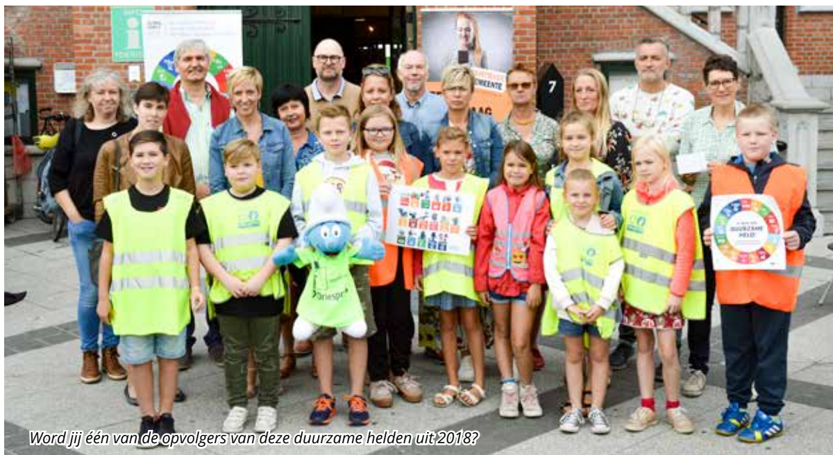
Word jij één van de opvolgers van deze duurzame helden uit 2018?