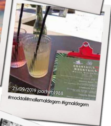
25/09/2019 joachim1988 #mocktail#mallemaldegem #igmaldegem