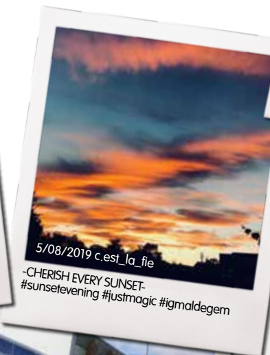
5/08/2019 c.est_la_fie -CHERISH EVERY SUNSET- #sunsetevening #ustimagic #igmaldegem