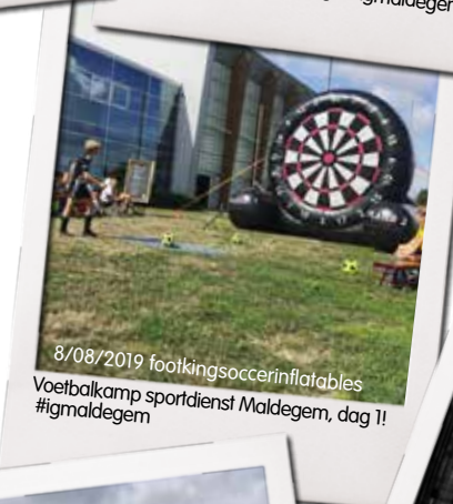
8/08/2019 footkingsoccerinflatables Voetbalkamp sportdienst Maldegem, dag 1! #igmaldegem