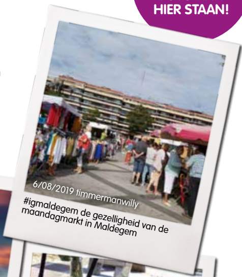
6/08/2019 timmermanwilly #igmaldegem de gezelligheid van de maandagmarkt in Maldegem