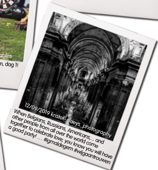
12/09/2019 kristof_laeyens_photography When Belgians, Russians, Americans... and other people from all over the world come together to celebrate love, you know you will have a good party! ... #igmaldegem #wijgaantrouwen