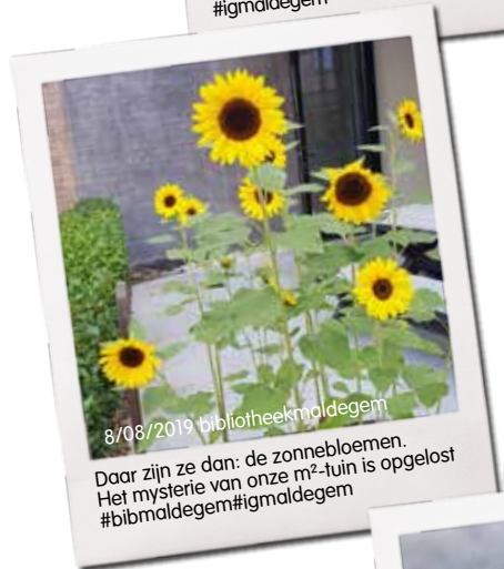
8/08/2019 bibliotheekmaldegem Daar zijn ze dan: de zonnebloemen. Het mysterie van onze m 2 -tuin is opgelost #bibmaldegem#igmaldegem