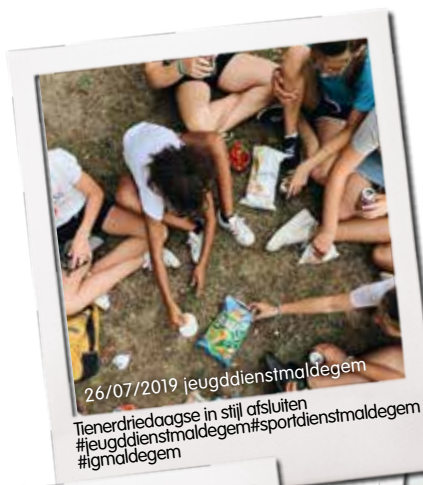
26/07/2019 jeugdendienstmaldegem Tienerdriedaagse in stijl afsluiten #jeugdendienstmaldegem#sportdienstmaldegem #igmaldegem

Je kan ons ook volgen, liken en delen via Facebook en Twitter.