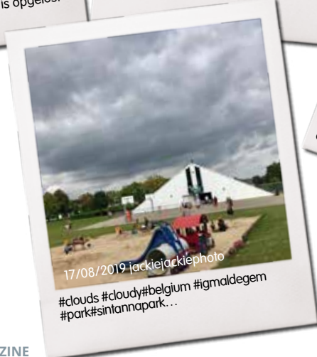
17/08/2019 jackiejackiephoto #clouds #cloudy#belgium #igmaldegem #park#sintannapark...