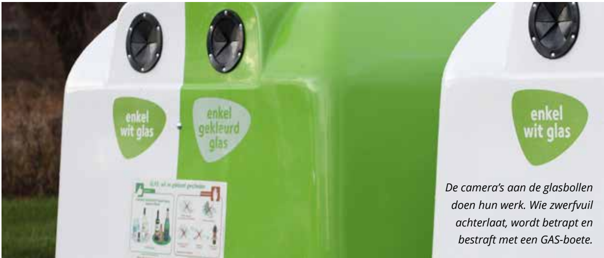
De camera's aan de glasbollen doen hun werk. Wie zwerfvuil achterlaat, wordt betrapt en bestraft met een GAS-boete.