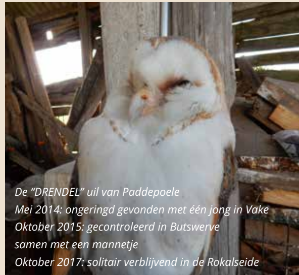
De "DRENDEL" uil van Paddepoele Mei 2014: ongeringd gevonden met één jong in Vake Oktober 2015: gecontroleerd in Butswerve samen met een mannetje Oktober 2017: solitair verblijvend in de Rokalseide

Uit de langjarige data van de Kerkuilwerkgroep Vlaanderen is Vlaamse bezettingsgraad van nestkasten circa 33 % (1 kast op 3 geeft broedsel). Voor Maldegem ligt dit percentage op zowat 55 %, t.t.z. 18 van de 32 nestkasten waren bezet. Op die basis is er voor Maldegem nog ruimte om kasten bij te plaatsen. ■