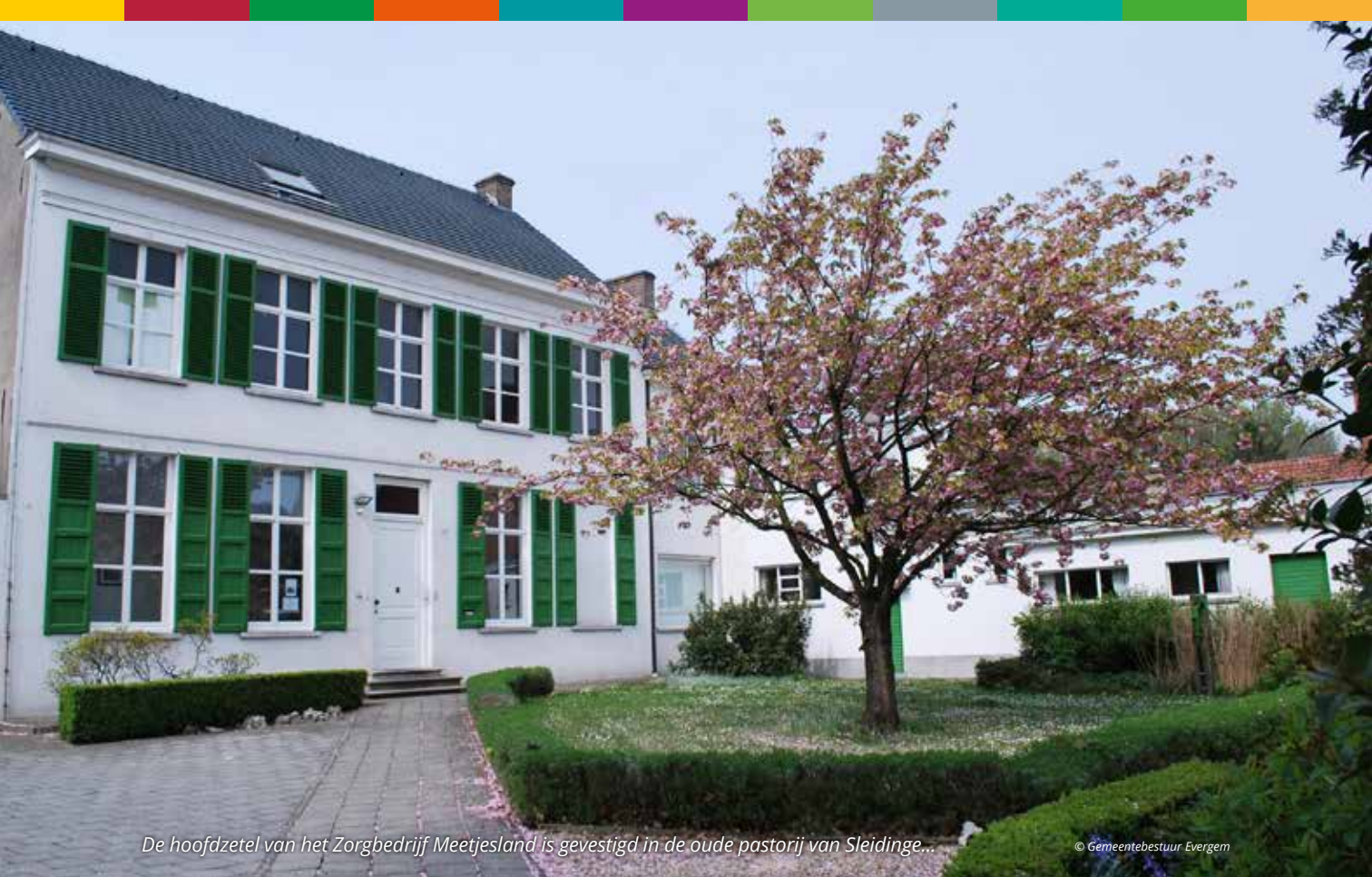
De hoofdzetel van het Zorgbedrijf Meetjesland is gevestigd in de oude pastorie van Sleidinge...