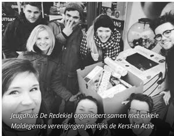
Jeugdhuis De Redekiel organiseert samen met enkele Maldegemse verenigingen jaarlijks de Kerst-in Actie

* Alle acties van de Warmste Week kan je raadplegen op www.dewarmsteweek.be