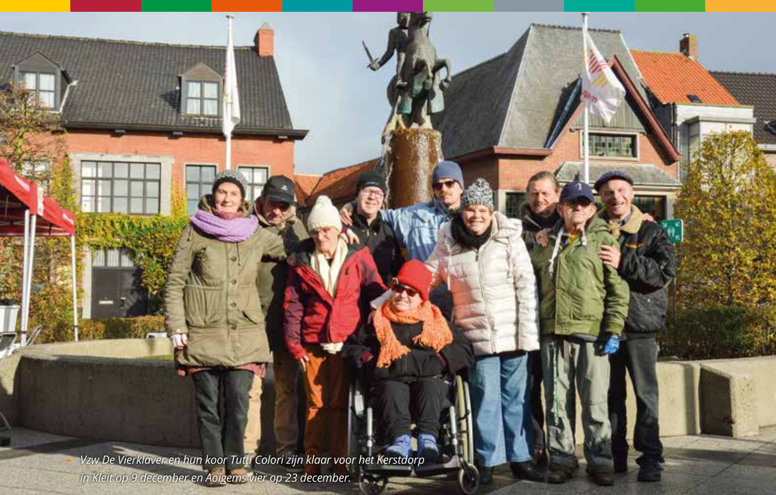
Vzw De Vierklaver en hun koor Tutti Colori zijn klaar voor het Kerstdorp in Kleit op 9 december en Aoigems vier op 23 december.