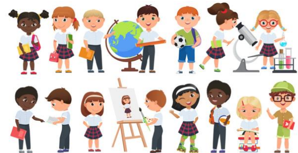
Praattafel voor kinderen