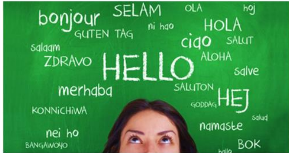
Praattafel Nederlands praten, samen.